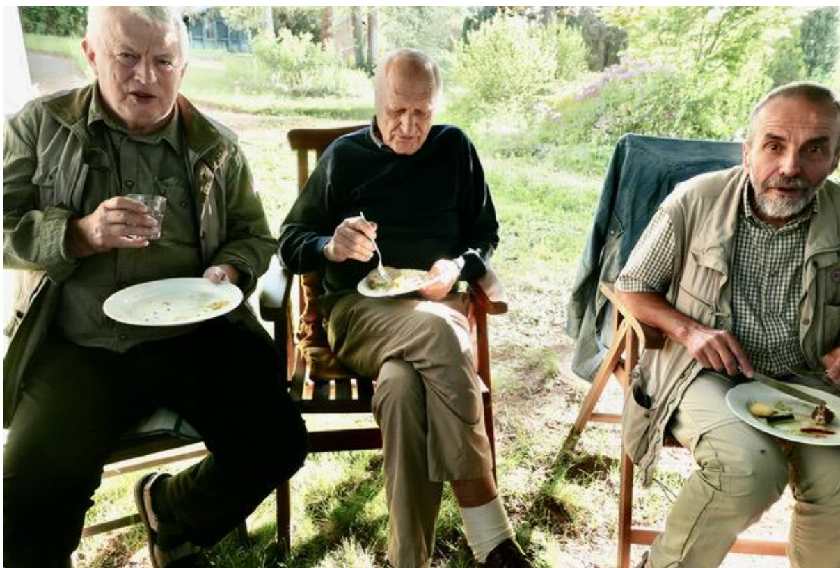
...a tady už je Pirilík , Pacík a Reyp dojíždají.