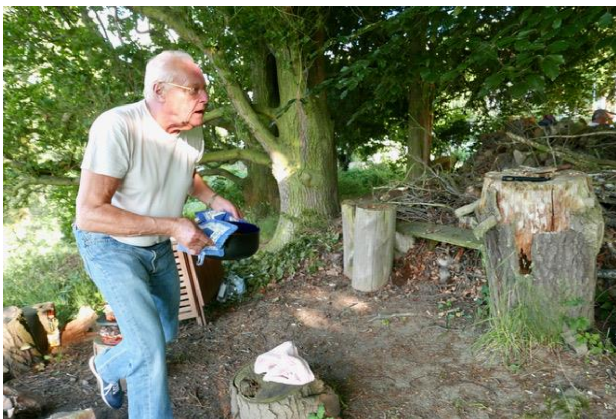
...a tady už je běží servírovat...