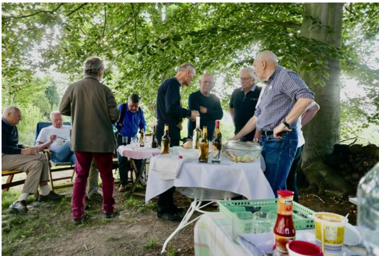
Hlavním programem bylo povídání u jídla a pití