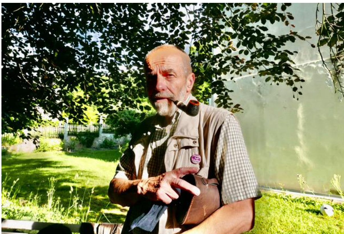
Většinou seriózní Reyp