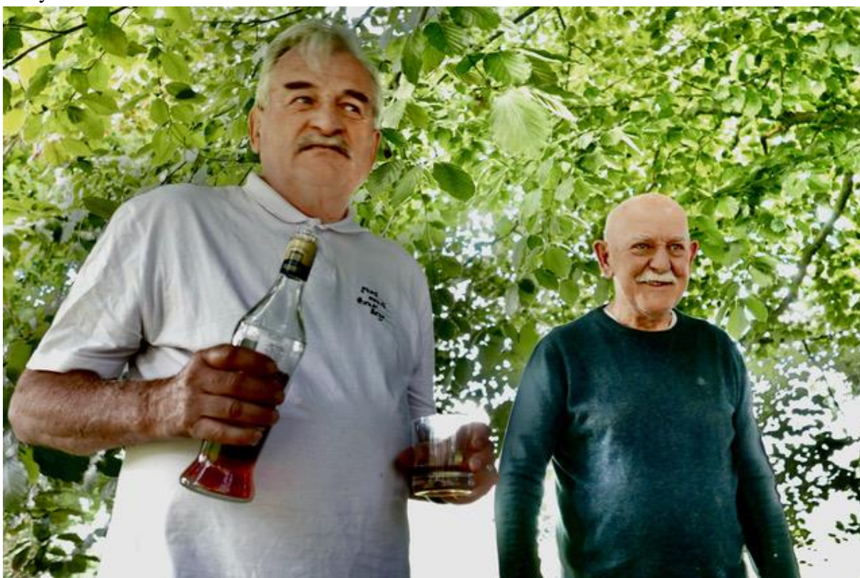
Yško nutil každému metaxu, a když byl odmítán, tak to pil sám