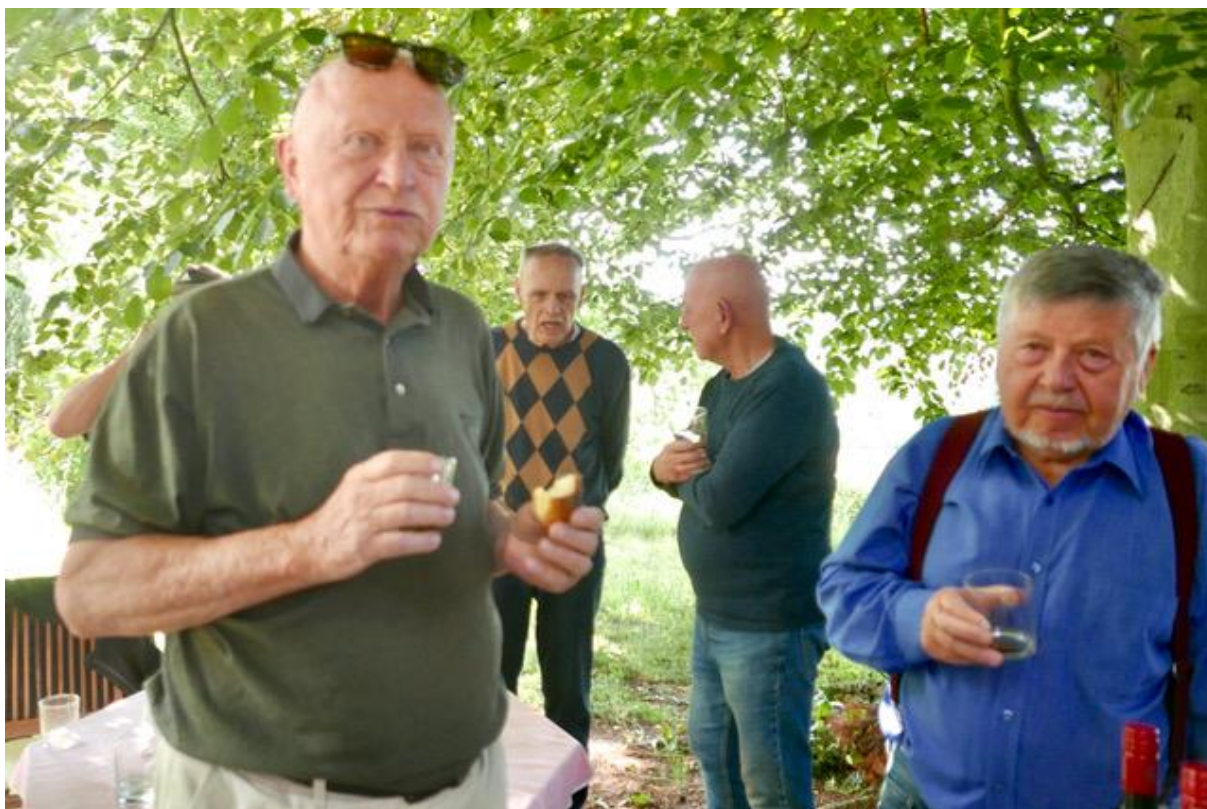
Cancidlo , jako obvykle, jí a Bob pije