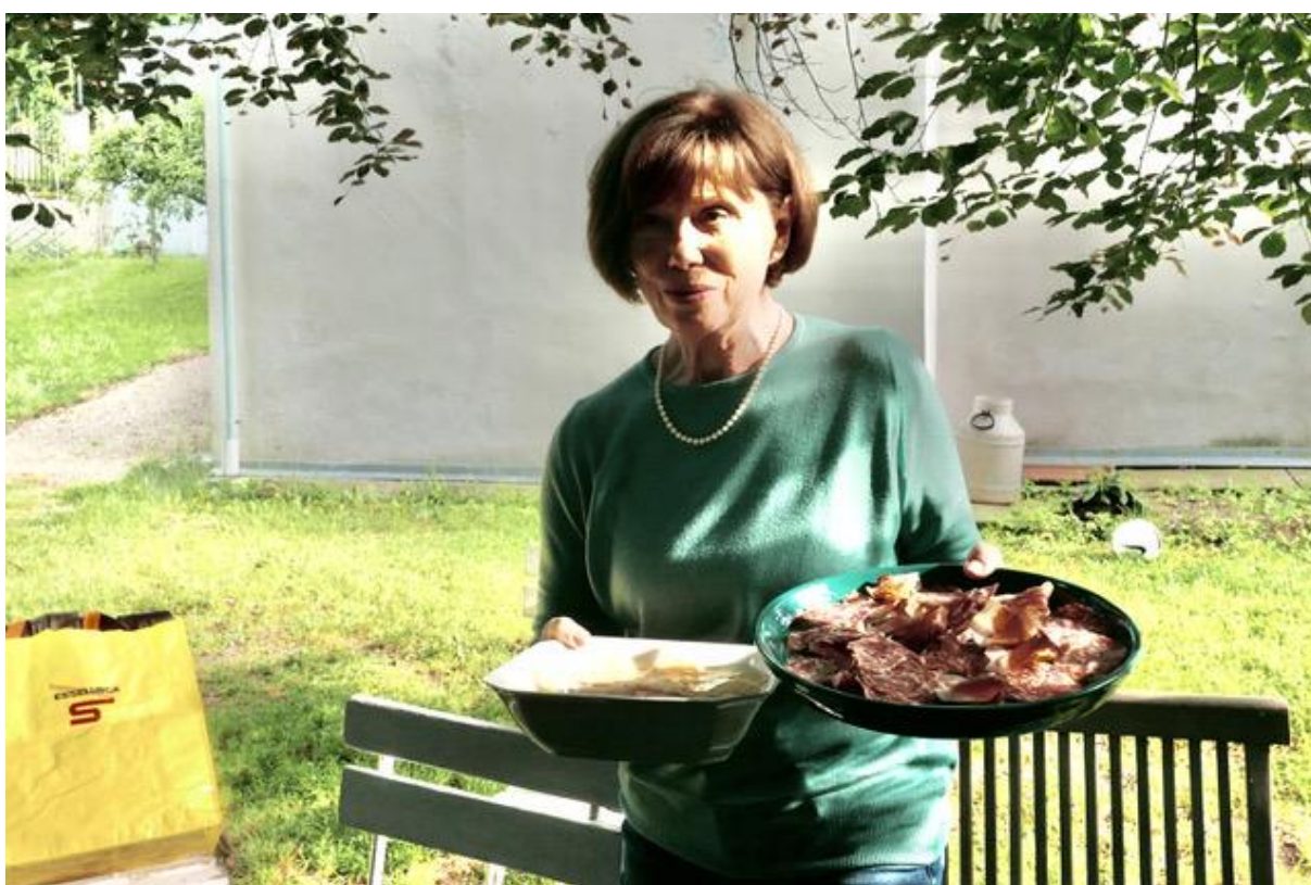
A pak začala nosit krkovice a saláty na stůl Asunta a my jsme už bohužel nemohli.