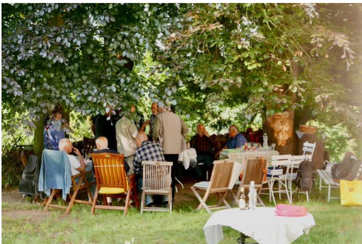
Idyla pod rozsochatými stromy