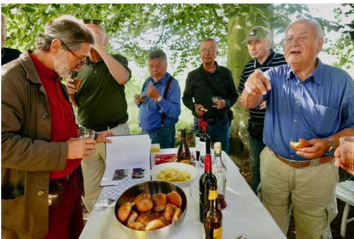
Mak si prohlíží svázané Plaváčky a Pegas někomu něco přikazuje