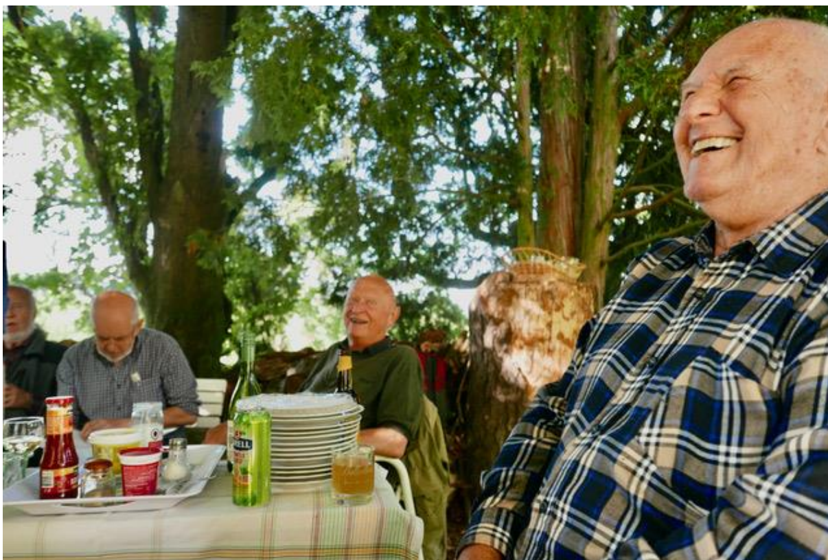
Bylo opravdu veselo