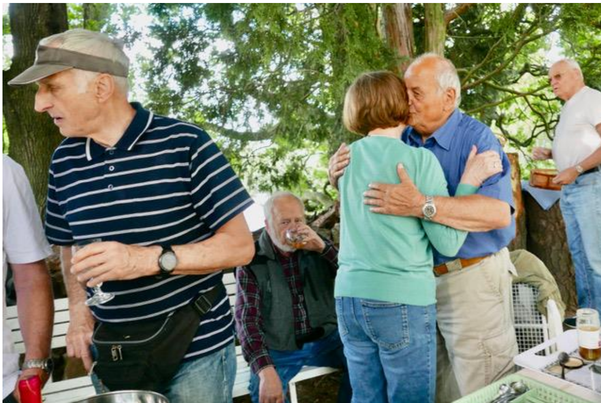
Holt, někdo vdolky, někdo holky.